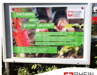
RHEIN SIEG Caritasverband Rhein-Sieg e.V.