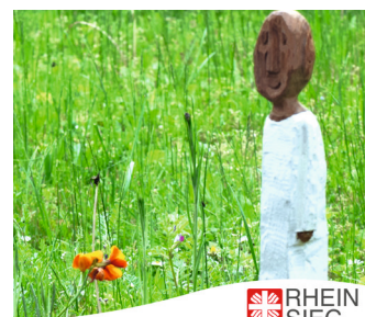
RHEIN SIEG Caritasverband Rhein-Sieg e.V.