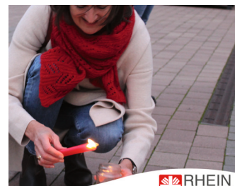
RHEIN SIEG Caritasverband Rhein-Sieg e.V.