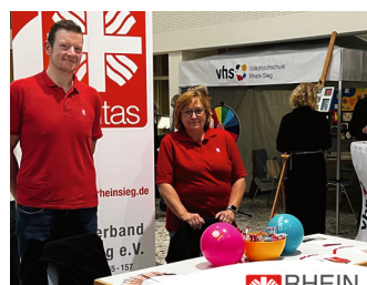
RHEIN SIEG Caritasverband Rhein-Sieg e.V.