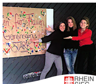
RHEIN SIEG Caritasverband Rhein-Sieg e.V.