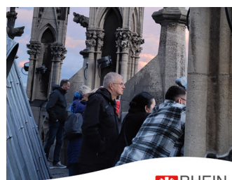
RHEIN SIEG Caritasverband Rhein-Sieg e.V.