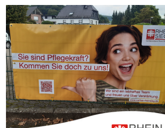
RHEIN SIEG Caritasverband Rhein-Sieg e.V.