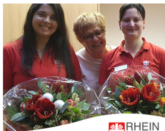
RHEIN SIEG Caritasverband Rhein-Sieg e.V.