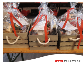
RHEIN SIEG Caritasverband Rhein-Sieg e.V.