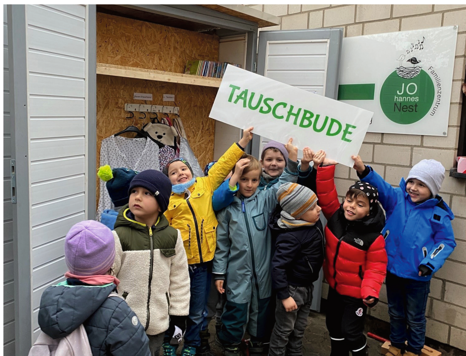
▲ Fröhliche Einweihung des stabilen Holzschrankes für gut erhaltene Kleidung, für Spielzeug oder Haushaltsgegenstände.