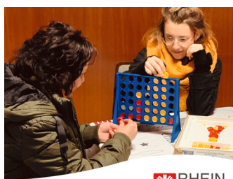
RHEIN SIEG Caritasverband Rhein-Sieg e.V.