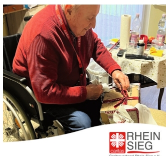
RHEIN SIEG Caritasverband Rhein-Sieg e.V.