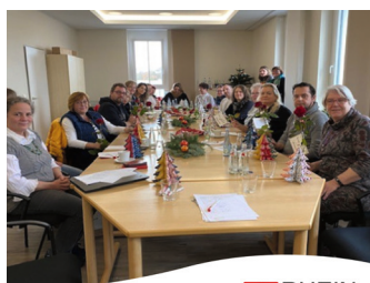
RHEIN SIEG Caritasverband Rhein-Sieg e.V.