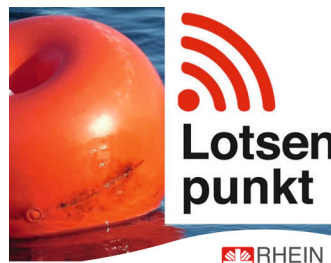
RHEIN SIEG Caritasverband Rhein-Sieg e.V.