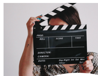
RHEIN SIEG Caritasverband Rhein-Sieg e.V.